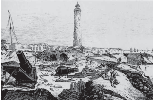
طابية الفنار بعد تدميرها.